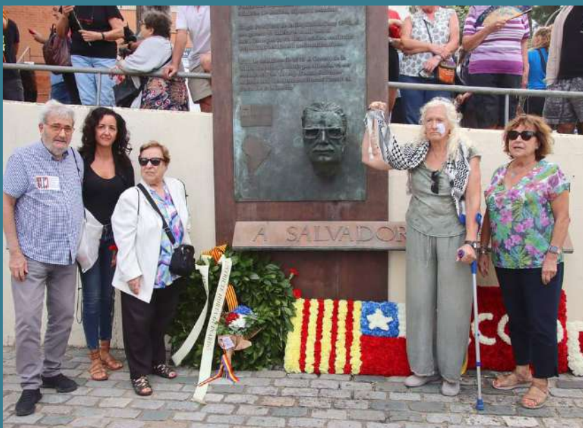
Ofrena de la elegació de l'Associació de Persones Ex Preseses Polítiques del Franquisme

Com cada any una delegació de la nostra associació va participar en l'ofrena.