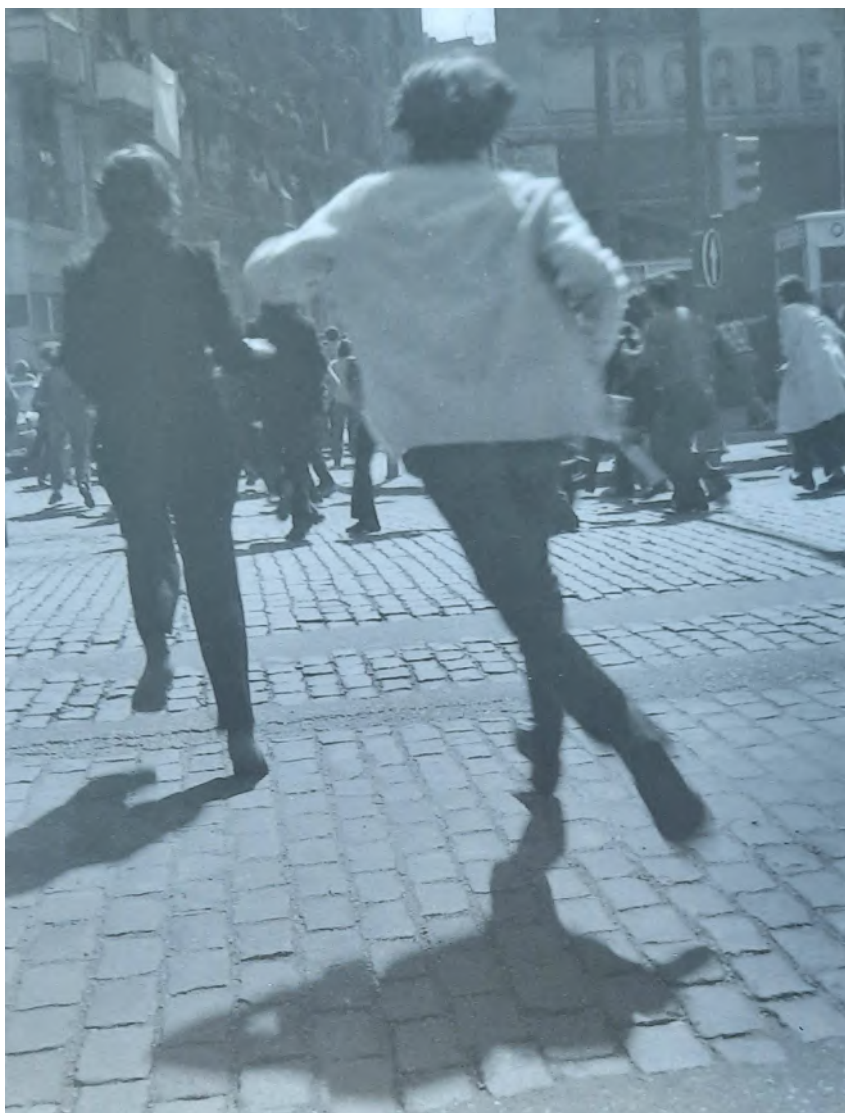
Manifestació il·legal.