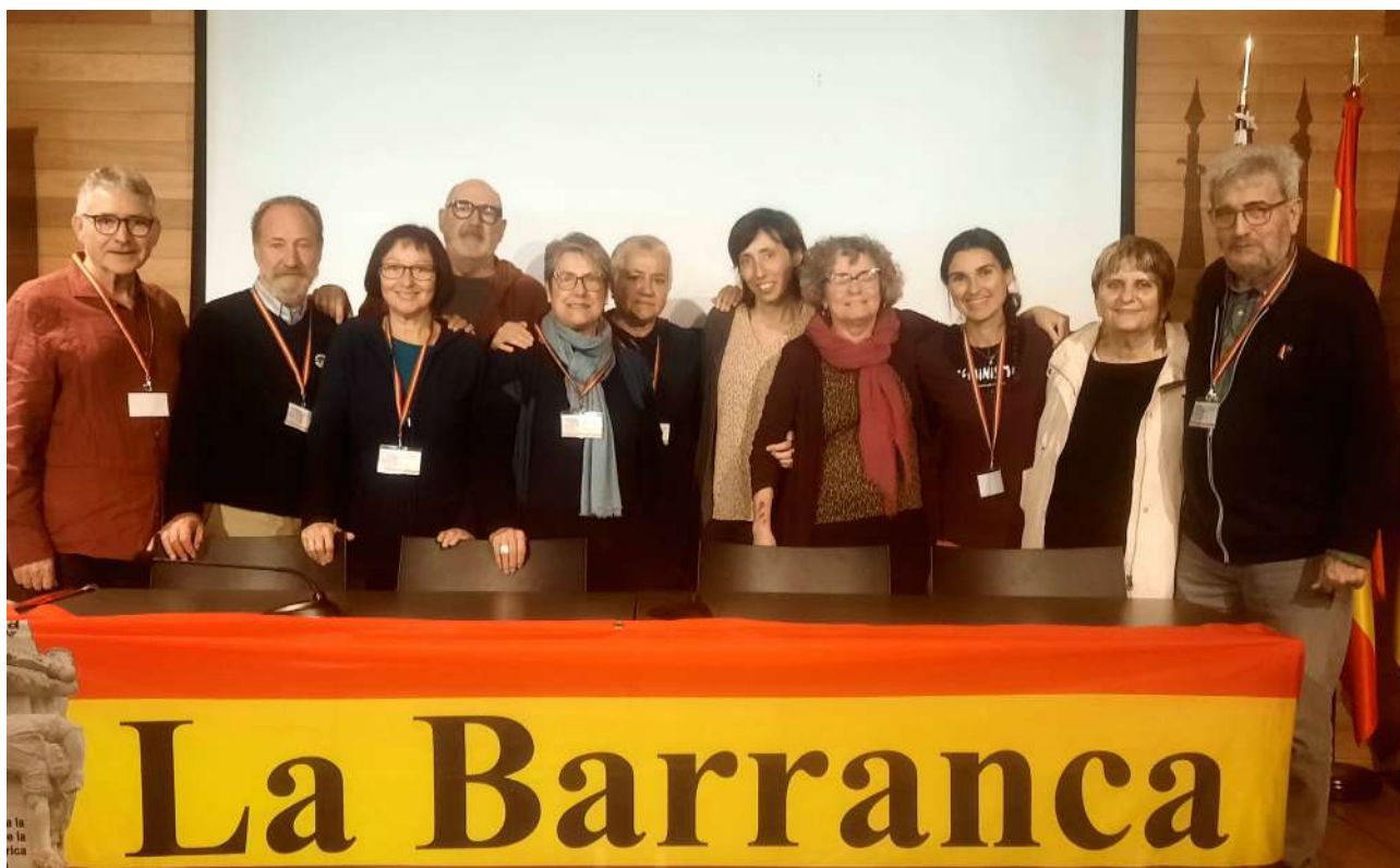
La delegació de Catalunya.

Tanto uno como otro suceso ponen de manifiesto el vigor de los discursos y las prácticas de la extrema derecha. En Israel, el gobierno ultraderechista actúa con total impunidad desde sus presupuestos racistas y supremacistas, que son apoyados por las extremas derechas europeas, que han pasado del antisemitismo a la islamofobia. En el segundo, el relato impuesto desde la extrema derecha ha llevado a que la inmigración sea considerada no solamente como un problema, sino a ser considerado el primero en la lista de preocupaciones de muchos europeos. Han conseguido vincular inmigración y